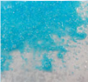
KRÄFTIGES BLAU (KOKAIN HCL)

SOFORT EIN KRÄFTIGES BLAU BLAU INNERHALB VON 10 SEKUNDEN KRÄFTIGES BLAU INNERHALB VON 10 SEKUNDEN MITTELBLAU INNERHALB VON 10 SEKUNDEN BLAU INNERHALB VON 10 SEKUNDEN BLAU INNERHALB VON 10 SEKUNDEN BLAUE FLECKEN INNERHALB VON 10 SEKUNDEN BLAU INNERHALB VON 10 SEKUNDEN BLAUE FLECKEN INNERHALB VON 10 SEKUNDEN