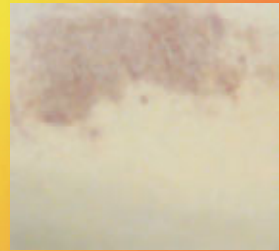
HEROIN / OPIUM