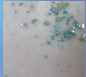
BLAUE FLECKEN (CRACK)

BEI EINER POSITIVEN REAKTION SENDEN SIE DAS BEWEISMITTEL GEMÄSS DEM STANDARD IHRER AGENTUR ZU WEITEREN LABORUNTERSUCHUNGEN EIN.