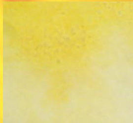
METHAMPHETAMIN / MDMA